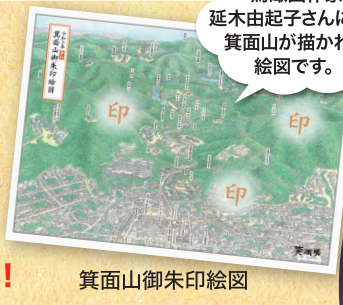
箕面山御朱印絵図